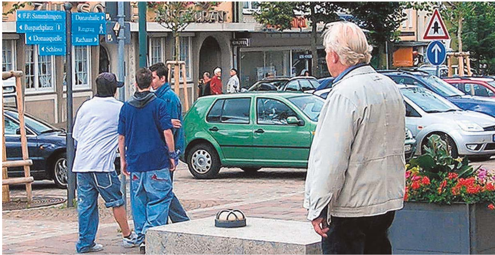
Alle schauen hin. Mischen sich aber auch alle ein, wenn jemand auf offener Straße attackiert wird? In nachgestellten Szenen machten die Schüler der 10c des Fürstenberg-Gymnasiums auf der Karlstraße die Probe aufs Exempel.